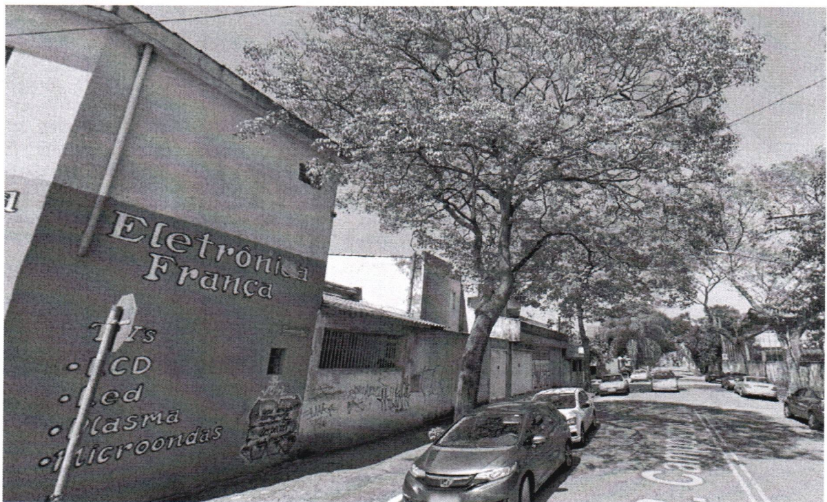
Rua Campos do Jordão, 216 - Bairro Baeta Neves