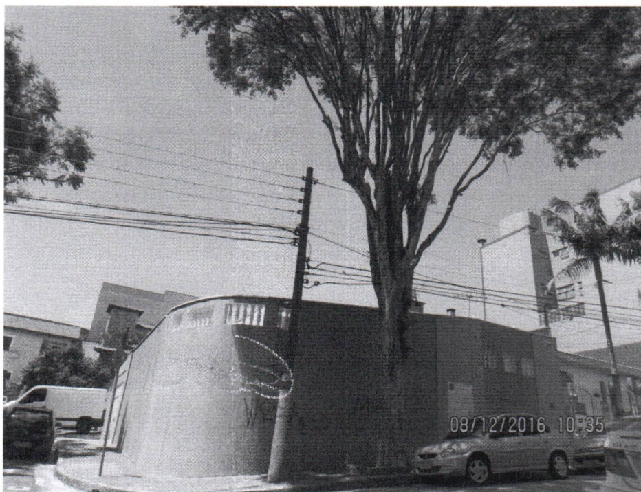
Fotos 1 a 2 – Rua Oragnof, 439 –Planalto - Subst.Grave Em.Of. 03 – 2019 – Ver. Aurélio

Árvore com raízes danificando o passeio público, impedindo a acessibilidade e oferecendo risco de queda. Portanto somos favoráveis a substituição.