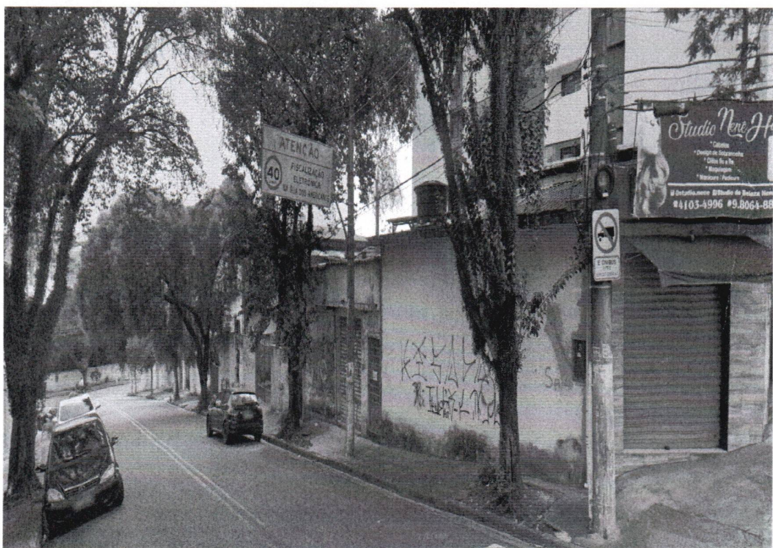
Rua Jacarei, 232 - B. Baeta Neves