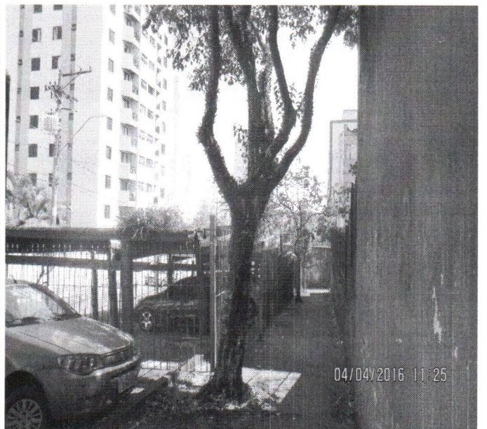
Foto 1 a 4 – Rua Padre Tarcisio Zanoti, 217 – Remoção – SBC 47387617