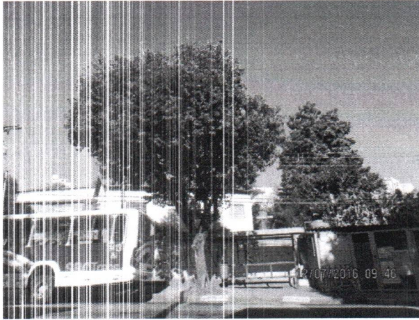
Fotos 1 a 3 – Av. Getúlio Vargas, 1959 – Baeta Neves – Subst. CI 144-2017