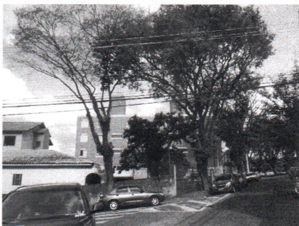
Fotos 1 a 4 – Rua Tiradentes, 141 – Centro – Remoção 1 e Substituição 1 – CI 614-2019 SU.3